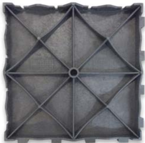
Dalle - Vue du dessous