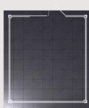
Kit de 90 dalles compatible avec les abris Grosfillex de 11 m 2 (Deco, Utility, Basic Home)