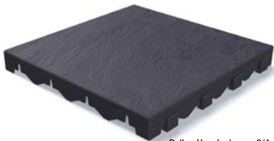
Dalle - Vue de dessus 3/4