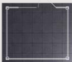
Kit de 42 dalles compatible avec les abris Grosfillex de 4,9 m 2 (Deco, Utility)