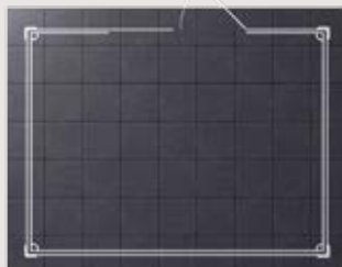
Kit de 63 dalles compatible avec les abris Grosfillex de 7,5 m 2 (Deco, Utility, Basic Home)