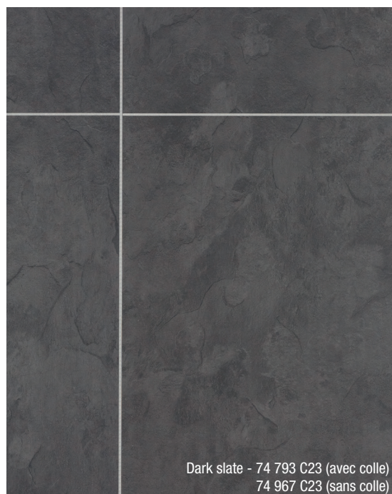
Dark slate - 74 793 C23 (avec colle) 74 967 C23 (sans colle)