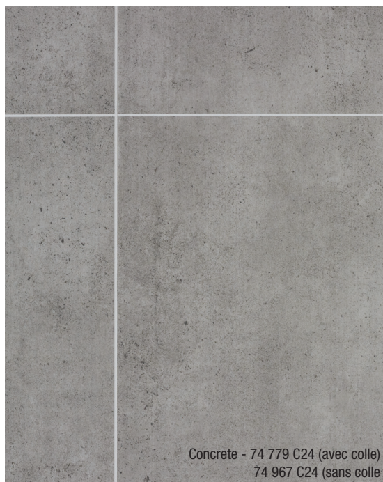
Concrete - 74 779 C24 (avec colle) 74 967 C24 (sans colle)