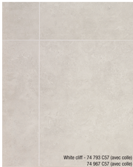
White cliff - 74 793 C57 (avec colle) 74 967 C57 (avec colle)